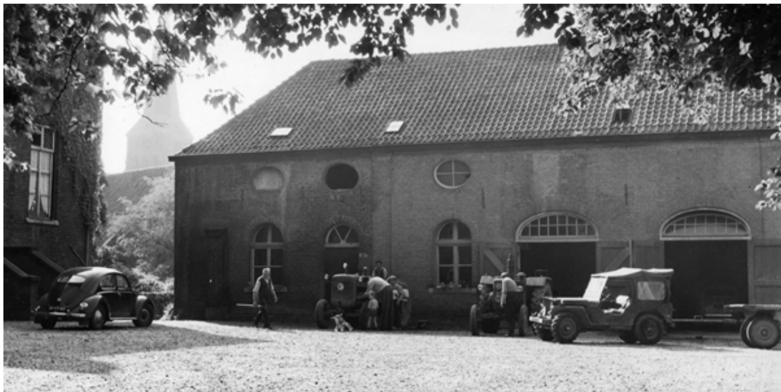
Beeld uit 1956.