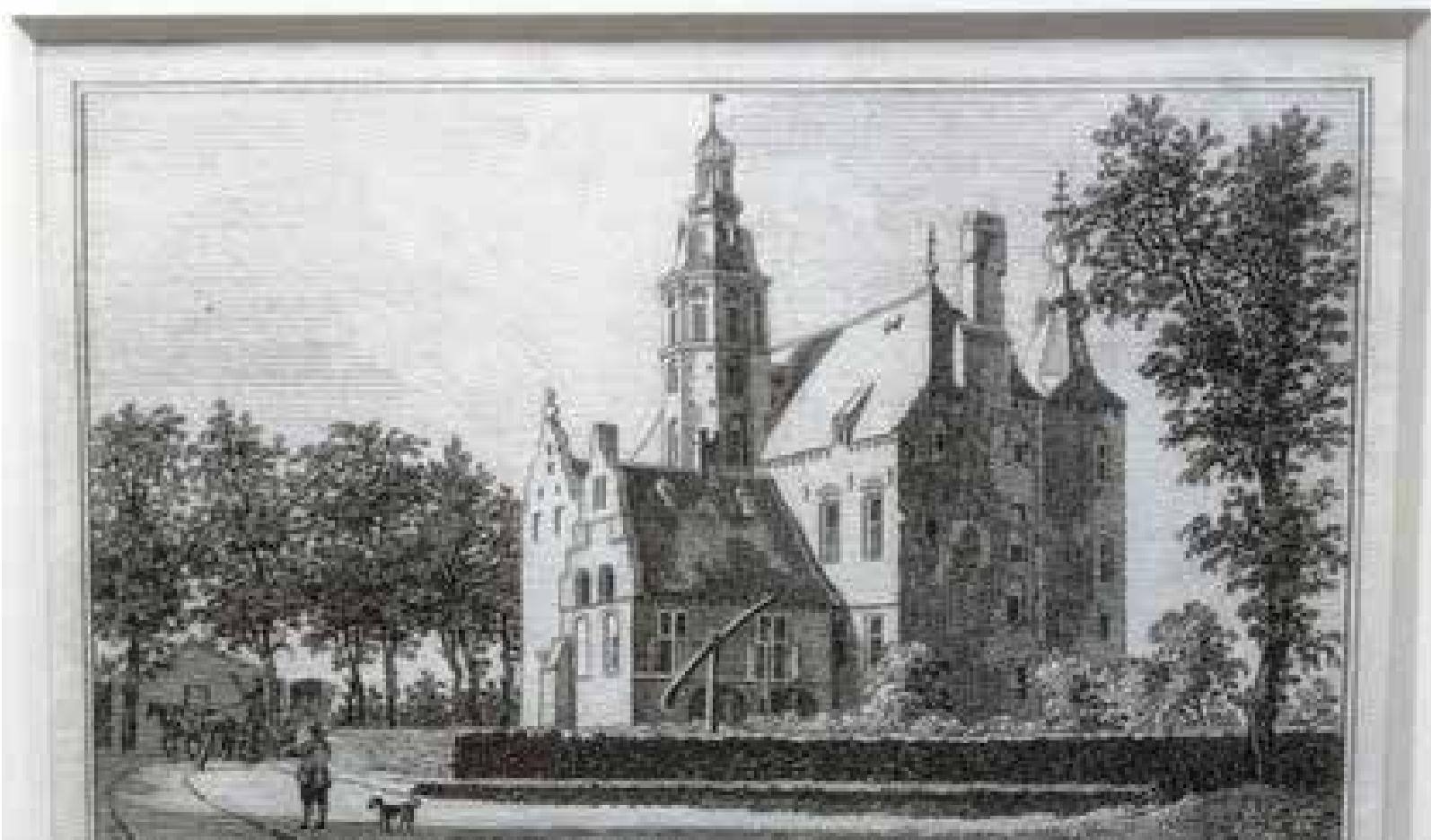
Huis te Seventer 1745

Anno 2019 is het landgoed onderdeel van de stichting die is vernoemd naar Huub van Nispen van Sevenaer. Hier steken vele vrijwilligers de handen uit de mouwen om de authentieke kasteelboerderij - één van de oudste, zo niet dé oudste van Nederland - te bewaren en te beschermen volgens de duurzaamheidsvisie van de jonkheer. "Hij was zijn tijd ver vooruit," besluit Frans. "Het is nu de vraag of zijn nalatenschap op de lange termijn omarmd zal worden en toekomstbestendig zal zijn."