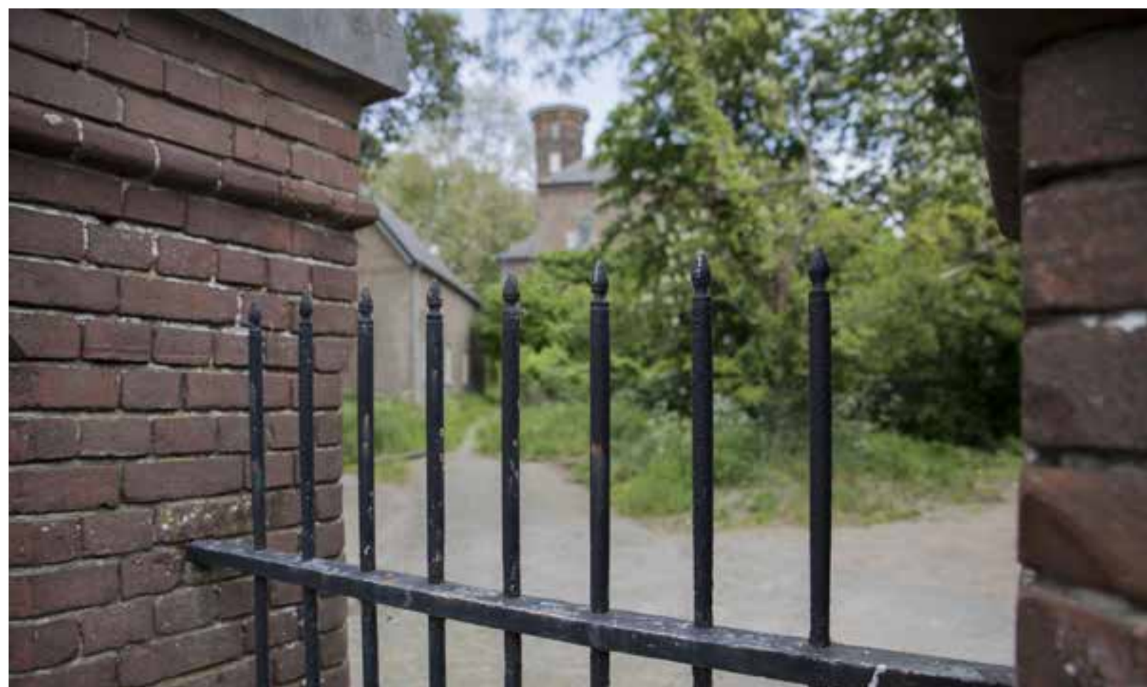
Pottenkijkers waren jaren geleden niet welkom op het landgoed. Die bleven achter het hek.

Een bijzondere ontmoeting eindigt met een handdruk. Ik mag gerust nog even op het landgoed rondkijken en ook beneden in de woning. Nee, niet boven. "Dat is niet nodig."