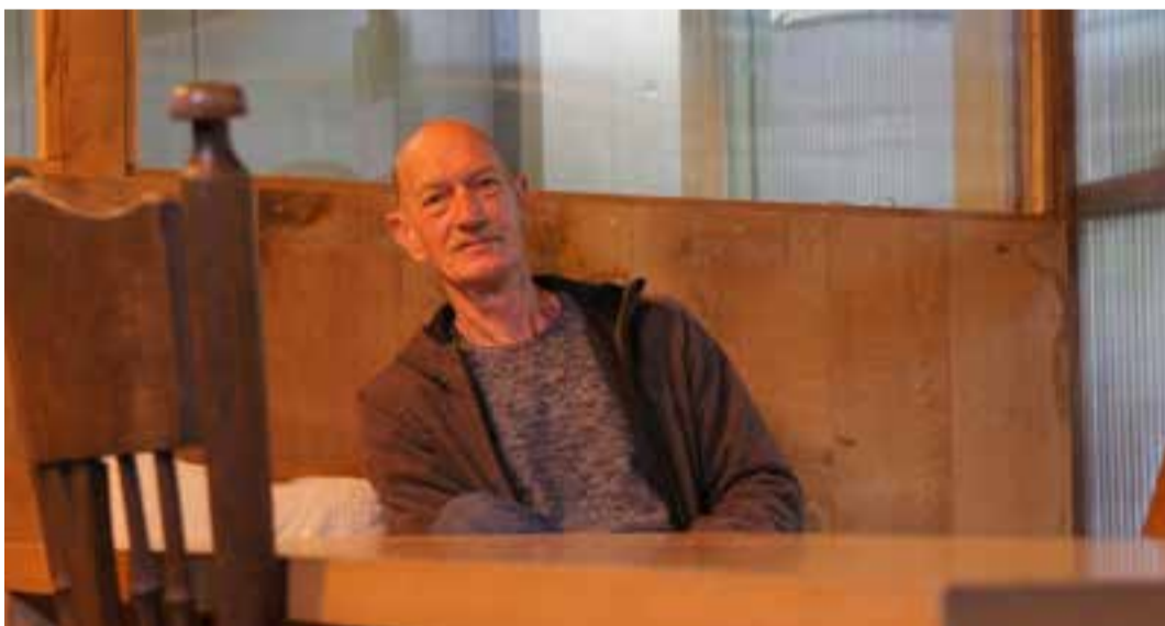
In Eddy's Place, de vrijwilligersruimte op het landgoed.

geen wereldvreemde, hij was zijn tijd ver vooruit met zijn gedachtegoed over biologische teelt. Dankzij zijn onuitputtelijke strijd het landgoed te beschermen tegen verstedelijking is de kasteelboerderij bewaard gebleven. Gelukkig is er na jaren van juridische procedures draagvlak vanuit de gemeente voor het behoud van het Landgoed.” Wel uit hij een zorg voor de toekomst. “Dit is een prachtige plek, met een perfect evenwicht tussen landbouw en natuur. Hopelijk blijft dat zo op het moment dat Woonpark BAT wordt gerealiseerd.”