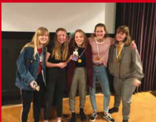
Winnaars korte film middaggroep