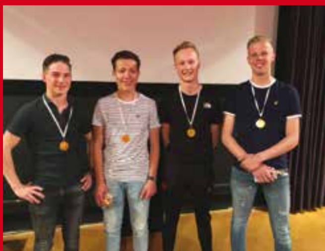
Winnaars korte film ochtendgroep