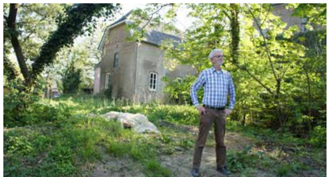
Voor veel Zevenaarders is het landgoed onbekend, mysterieus terrein